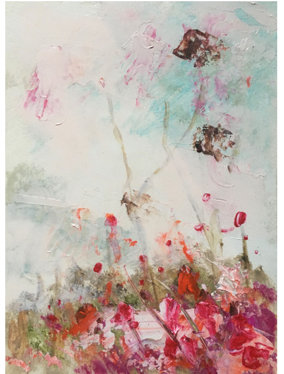
Bergmatte 2 Öl auf Papier 15 x 21cm gerahmt und signiert