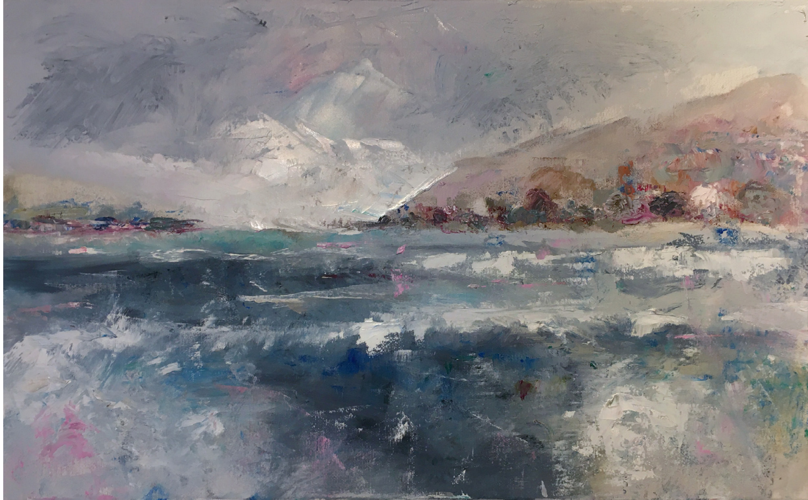
See Öl auf Leinwand 42 x 68 cm