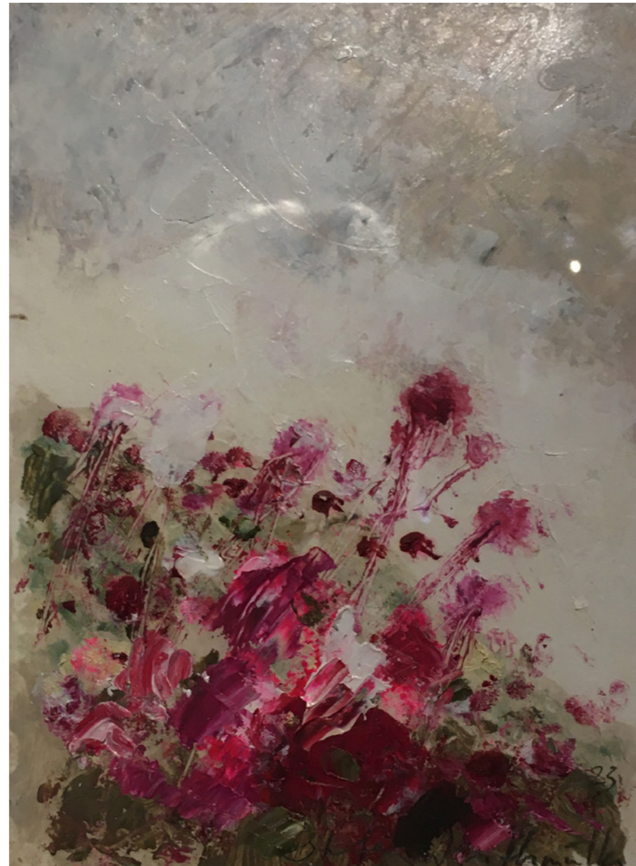
Bergmatte 1 Öl auf Papier 15 x 21cm gerahmt und signiert

Kann man mit Ölfarben auf Papier malen? Wird der Untergrund nicht alles Öl absaugen und die Farben stumpf und kreidig werden lassen? Bleibt die Leuchtkraft erhalten, der Glanz, die ganze Haptik? Und lässt sich im Kleinstformat auch so zaubern, wie im grossen? Virtuosität und Unbekümmertheit und die ganze Frische, bleibt das erhalten oder wird sich der Maler zum vorsichtigen Gäggeler wandeln? Zu einem Angstwesen, immer auf der Hut vor Fehlern? Verliert er im Kleinformat das Vertrauen in seine Korrekturfähigkeiten?